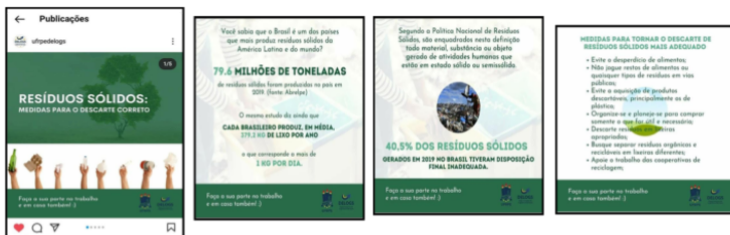
Figura 6- Publicações educativas sobre descarte responsável de resíduos

Diversas postagens foram realizadas com o intuito de sensibilizar a comunidade acadêmica quanto ao descarte correto; as campanhas foram realizadas no instagram do Departamento de Logística e Serviços com o tema “Resíduos Sólidos: medidas para o descarte correto”. Mais uma vez, embora o descarte de resíduos tenha sido significativamente reduzido em virtude do menor fluxo de pessoas nos campi da UFRPE, as postagens serviram para sensibilização quanto ao descarte de resíduos independente de qual lugar seja feito.