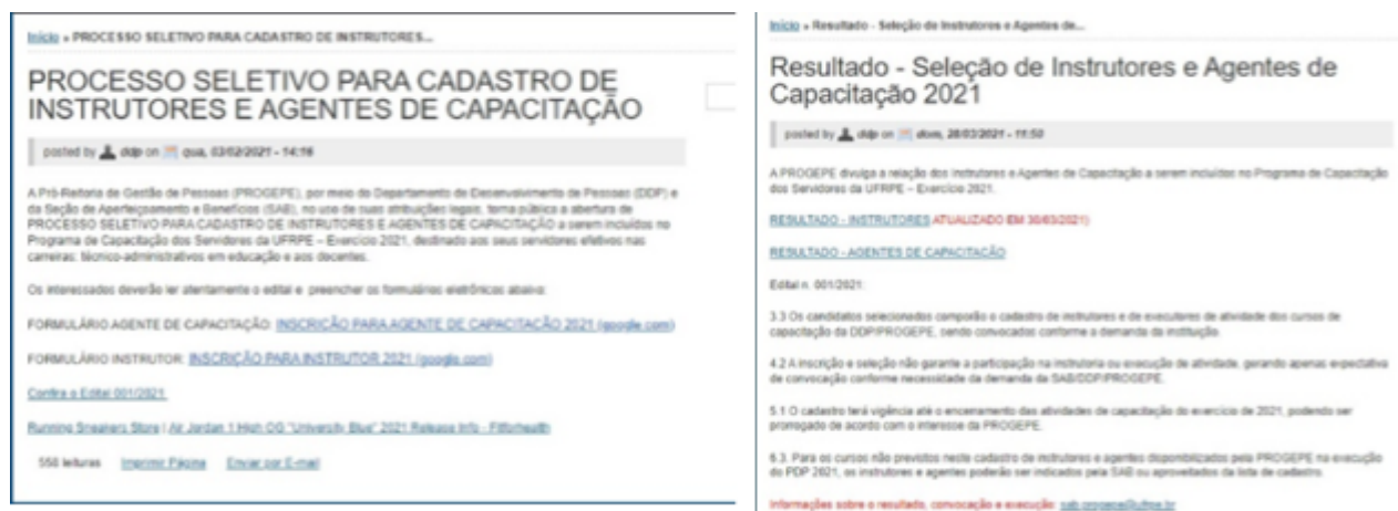
Figura 11- Processo seletivo para cadastro de Instrutores

A seleção ocorreu no mês de abril de 2021 e o resultado da seleção foi divulgado em maio. Ambos, edital e resultado, podem ser consultados no antigo site da PROGEPE ( http://www.sugep.ufrpe.br ), no qual consta também a lista com a classificação dos selecionados.