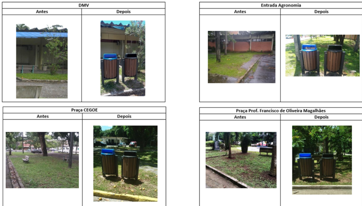
Figura 7- Novos recipientes para coleta de resíduos