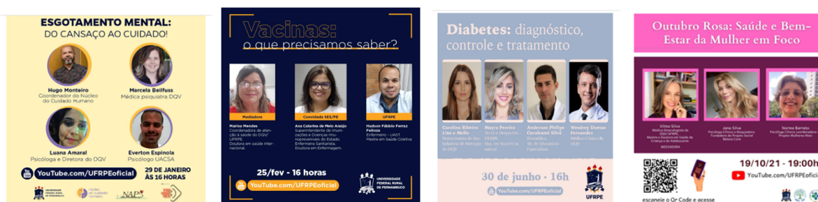
Figura 8- Campanhas de promoção da saúde

Embora nem todos os meses atividades síncronas, como LIVES ou rodas de conversa, tenham sido realizadas, todavia a totalidade de temas do calendário de saúde do Ministério da Saúde foram abordados tanto no Instagram @promoçãodesaudeqy como no @seac. Além disso, foi criado nos canais de podcast, o canal podqv que traz mensalmente várias informações de especialistas sobre diversos assuntos. Portanto, todo o calendário de saúde proposto pelo Ministério da Saúde foi cumprido a rigor, sendo esta meta concluída.