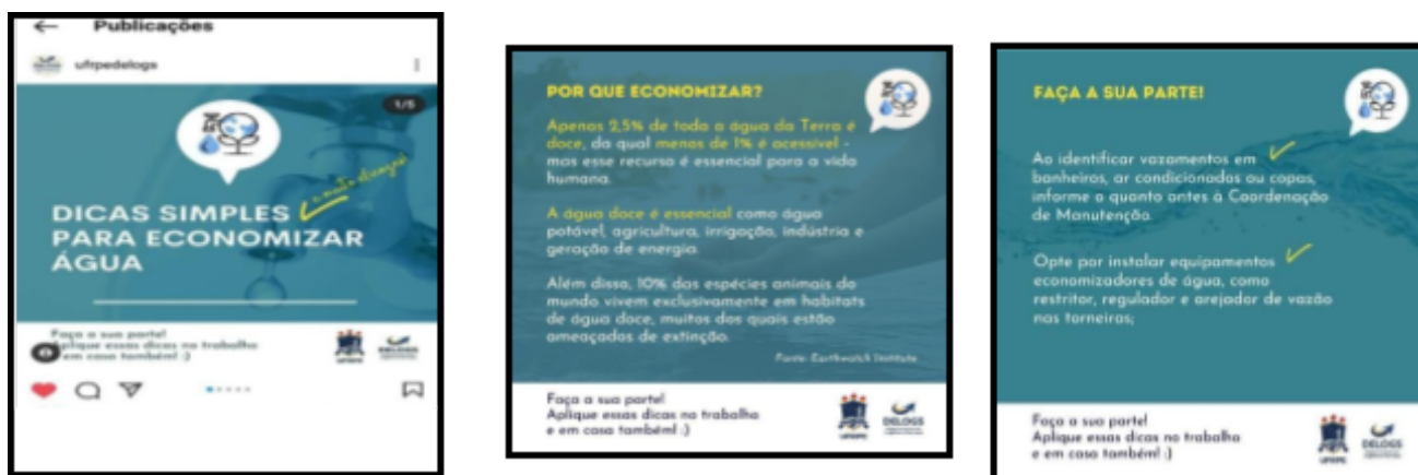
Figura 5- Publicações educativas sobre consumo consciente de água

Diversas postagens foram realizadas com o intuito de sensibilizar a comunidade acadêmica quanto ao uso racional da água; as campanhas foram realizadas no instagram do Departamento de Logística e Serviços com o tema “Dicas simples para economizar água”..