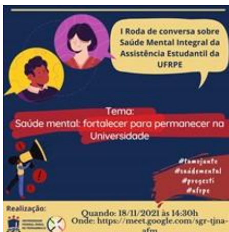
Figura 10- 1 Roda de conversa sobre Saúde Mental Integral da Assistência Estudantil da UFRPE

saúde mental, desenvolvidas pelo Grupo de estudos em Saúde Mental da Assistência Estudantil, como: rodas de diálogos, palestras e atendimento psicológico.