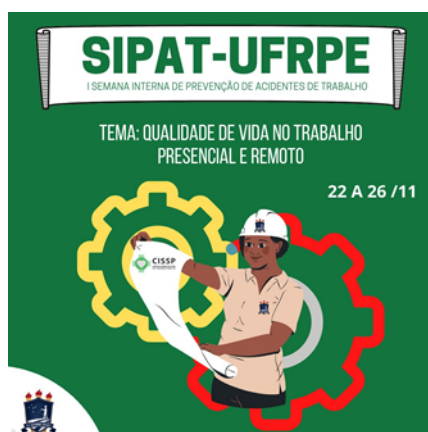
Figura 9- I Semana Interna de Prevenção de Acidentes de Trabalho

Foi realizada, em parceria com a comissão organizadora da SIPAT, do dia 22 a 26 de novembro, a I Semana Interna de Prevenção de Acidentes de Trabalho. As inscrições foram abertas ao público geral, franqueando participação a todos e a possibilidade de acompanhar profissionais que vão contribuir com qualidade de trabalhos e com novos conhecimentos. A participação no evento emitiu certificado.