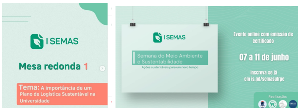
Figura 12- Semana do Meio Ambiente e Sustentabilidade