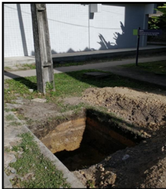
Figura 4- Escavação do ponto onde vai ficar o reservatório elevado de água pluvial