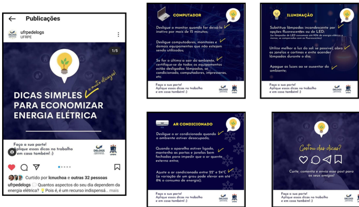
Figura 1- Postagens sobre conscientização no uso da Energia