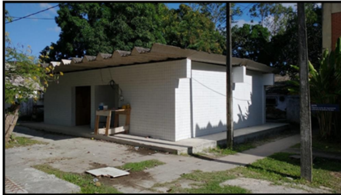
Figura 3- Banheiro Externo Departamento de Agronomia

A proposta foi a de elaboração de Projeto de captação e aproveitamento da água da chuva para o banheiro externo localizado no Departamento de Agronomia. Esta ação foi concluída com sucesso. Não apenas o projeto foi elaborado, mas a própria execução de implementação do sistema de aproveitamento de água da chuva foi iniciado.