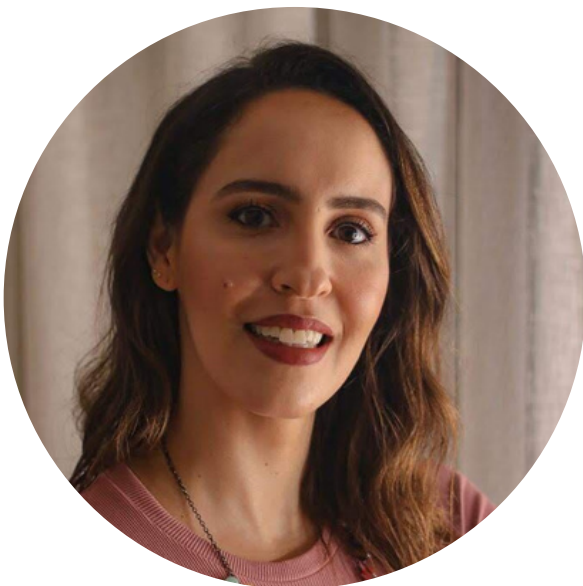
Coordenadora de Modernização Organizacional