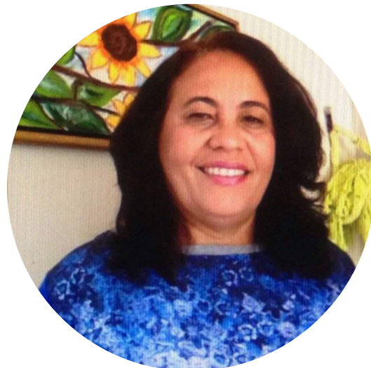
Chefe da Seção de Análise de Processos